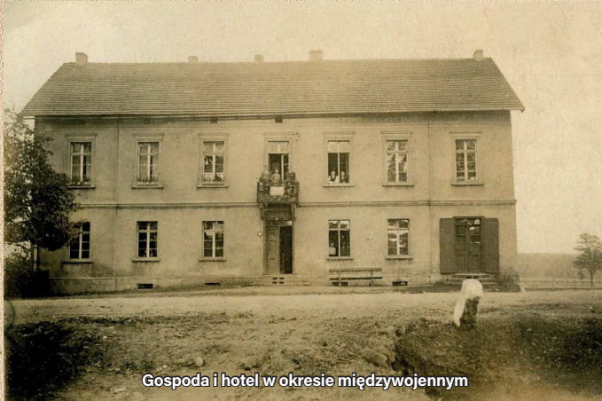
Gospoda i hotel w okresie międzywojennym

Zwieńczeniem minicyklu o gospodach na pograniczu Ornontowic i Orzesza jest prezentowana niżej fotografia gospody należącej do rodziny Hauke .