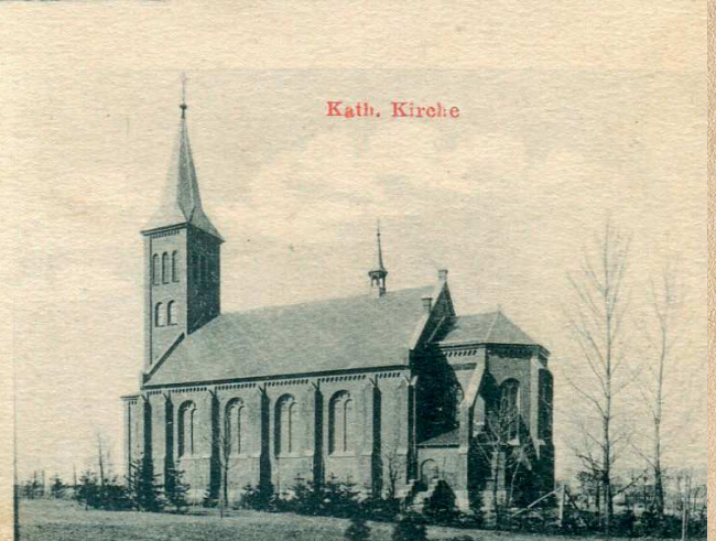
Gruss aus Ornontowitz

Na pocztówce pochodzącej z ok. 1910 roku uwieczniono cztery różne, ale znaczące budowle ówczesnych Ornontowic .