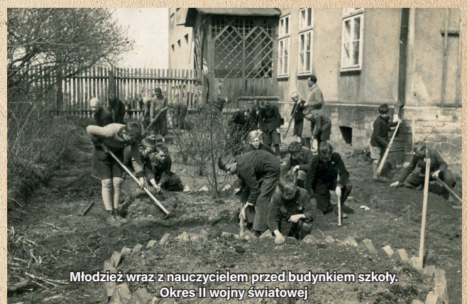
Młodzież wraz z nauczycielem przed budynkiem szkoły. Okres II wojny światowej

Do 1885 roku młodzież pobierała naukę wyłącznie w starej szkole, wybudowanej na gruncie kościelnym tuż obok drewnianego kościoła. Potrzeba budowy nowej wynikała nie tylko z przepełnienia dotychczasowego budynku, ale też korespondowała z ówczesną polityką władz pruskich walczących w ramach kulturkampf z Kościołem katolickim. Dlatego nowy, większy i finansowany przez państwo budynek wzniesiono na gruncie gminnym i zlokalizowano go w miejscu dzisiejszego biura rachunkowego.