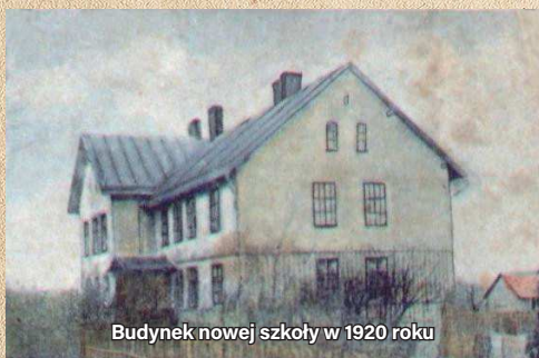
Budynek nowej szkoły w 1920 roku

Z chwilą oddania do użytku nowej szkoły nauczanie zostało podzielone na dwa budynki. W nowym uczyły się klasy I–IV, a do „starej szkoły” przydzielono klasy V–VII. W okresie II wojny światowej, kiedy obowiązywała szkoła niemiecka, naukę prowadzono jedynie w nowym budynku ze względu na braki w kadrze nauczycielskiej, a klasy były niejednokrotnie łączone. W wyniku działań wojennych ze stycznia 1945 roku nowa szkoła spłonęła, stając się ruiną rozebraną dopiero po wojnie.