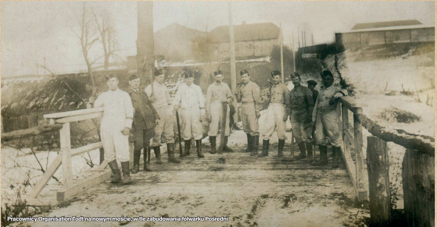
Pracownicy Organisation Todt na nowym moście, w tle zabudowania folwarku Pośredni

Publikowana w aktualnym zeszycie historycznym wyjątkowa fotografia z okresu II wojny światowej przedstawia nieistniejące już dziś zabudowania folwarku Pośredni (niem. Mittelhof ). Została wykonana przypuszczalnie w 1940 roku z okazji ukończenia budowy nowego mostu drogowego nad Potokiem Ornontowickim w ciągu dzisiejszej ul. Pośredniej .