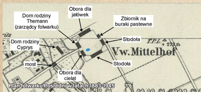
Plan folwarku Pośredni w latach 1883-1945

Widoczny powyżej folwark miał swoją historię i zaznaczony był na mapach sprzed 300 lat.